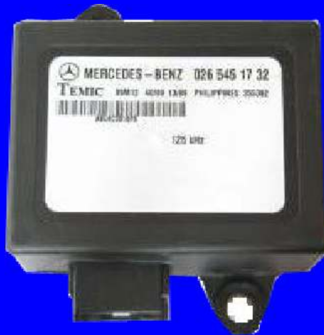
IMOBILIZADOR TEMIC MC68H05X16