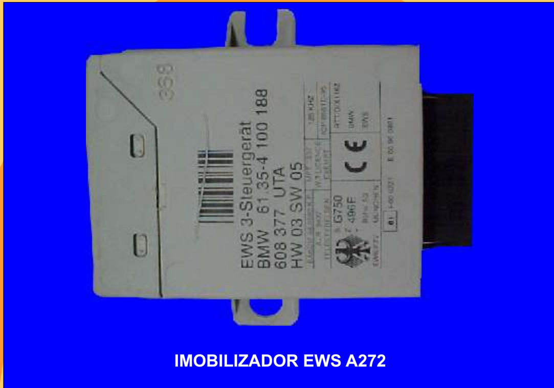
IMOBILIZADOR EWS A272