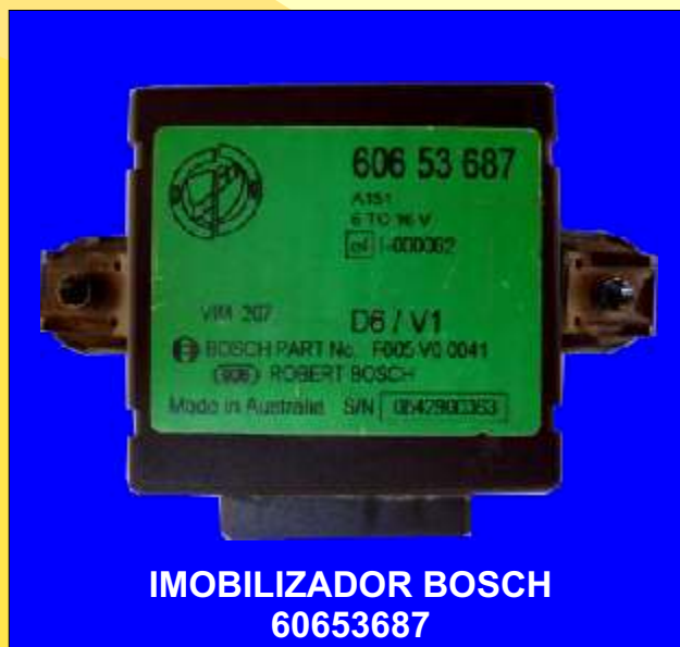
IMOBILIZADOR BOSCH 60653687