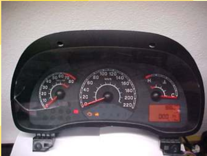
Painel Siemens 24C16