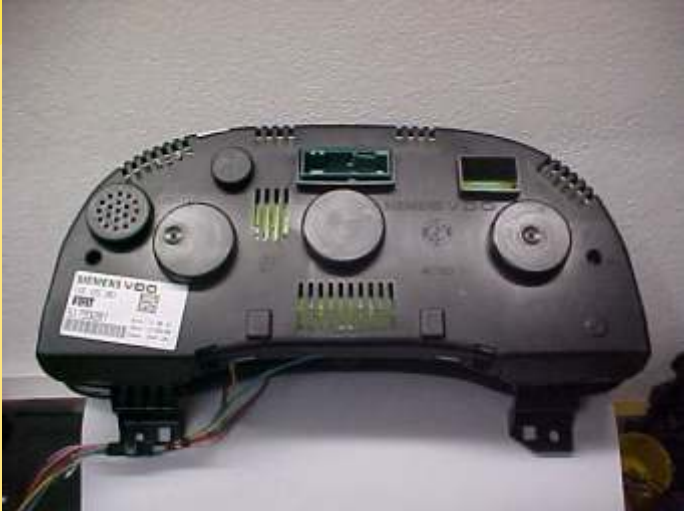
Etiqueta de Identificação do Painel Siemens 24C16